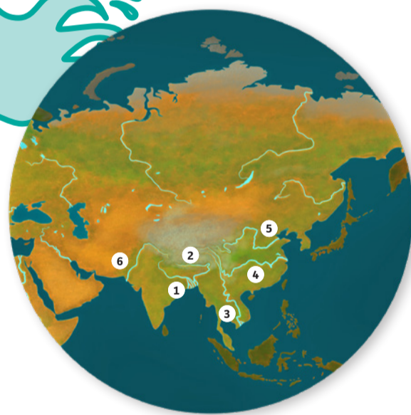
1. GANGES, 2. BRAHMAPUTRA, 3. MEKONG, 4. YANGTSÉ, 5. HUANG HE (AMARILLO), 6. INDO

Asia, el mayor continente de nuestro planeta, cubre un área de 43.540.000 kilómetros cuadrados. No solo es muy montañosa, sino que tiene el pico más alto del mundo, el monte Everest. Sin embargo, sus ríos no se encuentran entre los más largos. Grandes partes de Asia son endorreicas, lo que quiere decir que sus ríos tienden a secarse, desaparecer bajo el suelo o desembocar en un lago, no en un océano.